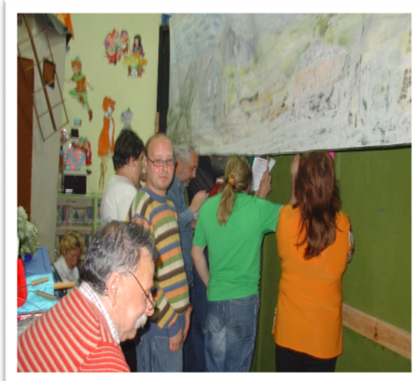
Ensayos con las profes del Conservatorio.